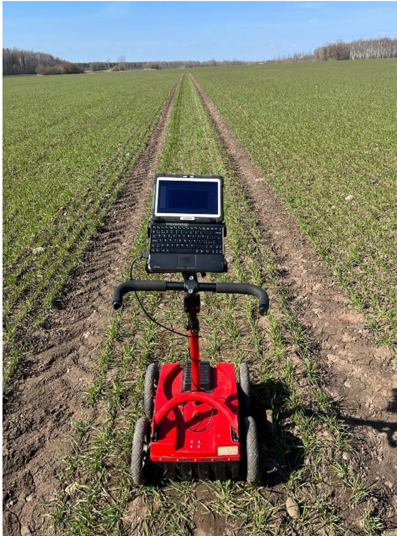
Ģeoradars COBRA