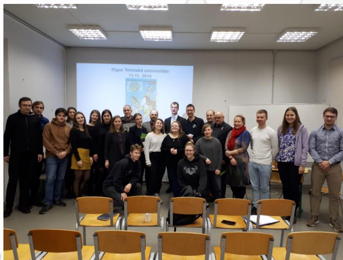
Attēlā: ĢIS dienas 2019 lektori, klausītāji un dalībnieki RTU Ģeomātikas katedrā.