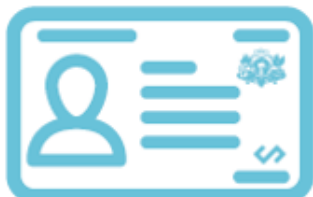
eParaksts eID kartē